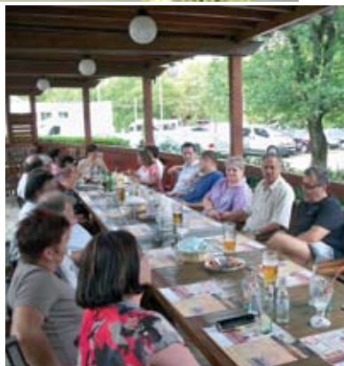
Lejegyezte: Posztós Endre, SZB titkár

Késő este érkezett vissza a csoport Pestre, kissé törődött, ám azzal a biztos tudattal, hogy a kirándulás adta élmény bőven megérte a fáradságot.