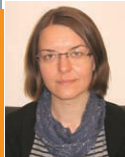
A szakmai anyagot készítette: Dr. Schnider Marianna, jogász