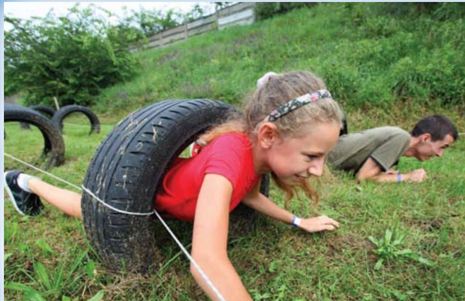
A VDSZ 2015. ÉVI SPORTRENDEZVÉNYEI