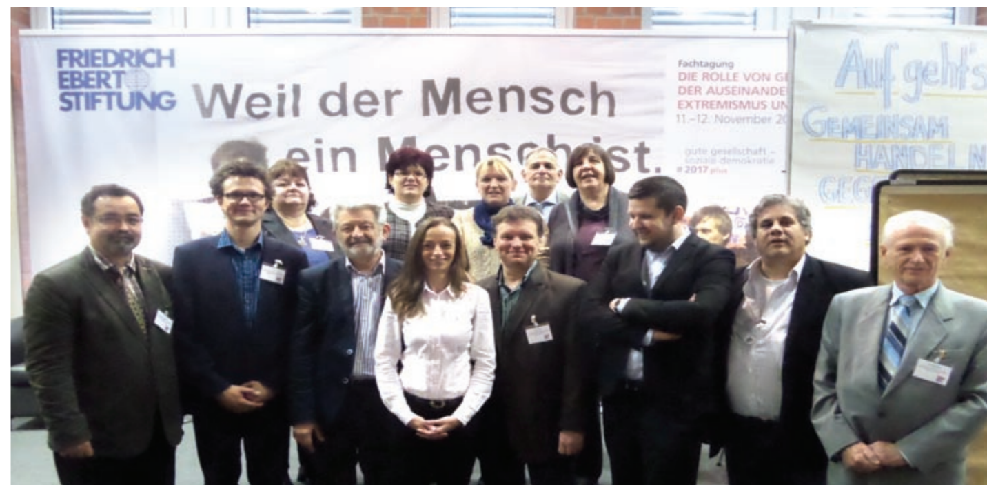
KONFERENCIA: A SZAKSZERVEZETEK ÉS A SZÉLSŐJOBBOSSOK VISZONYA

A klímaváltozás miatti szénmonoxid kibocsátással kapcsolatos nemzetközi rendelkezések és az ezekkel kapcsolatos kötelezettségek nagymértékben érintik a vegyipari ágazatot – állapították meg a tanácskozás résztvevői. A témával kapcsolatban az ÁPB közös állásfoglalást fog kialakítani.