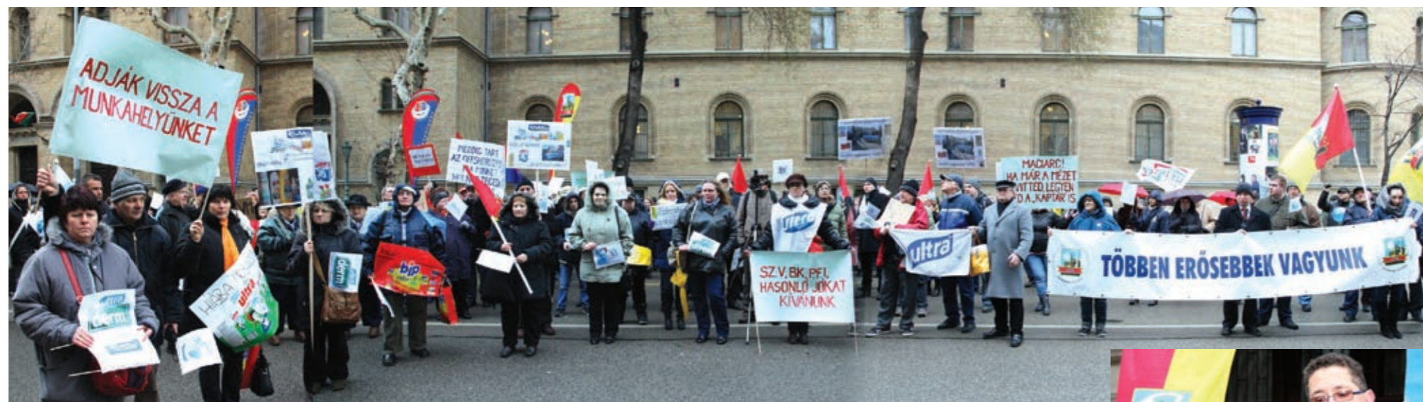
EVM: VÉGET ÉRT 90 EMBER HOSSZÚ KÁLVÁRIÁJA