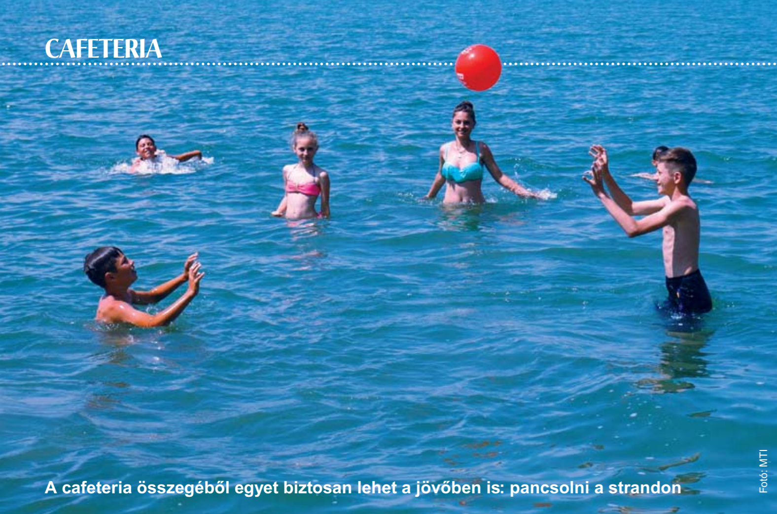
A cafeteria összegéből egyet biztosan lehet a jövőben is: pancsolni a strandon