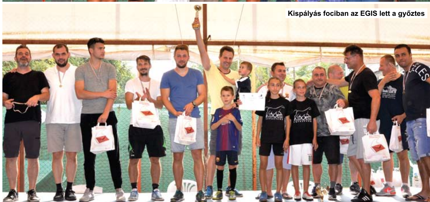
Kispályás fociban az EGIS lett a győztes