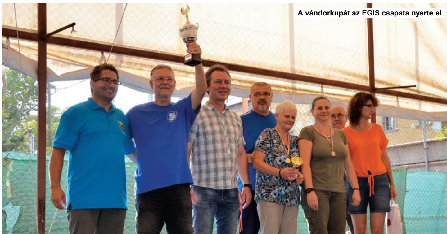
A vándorkupát az EGIS csapata nyerte el