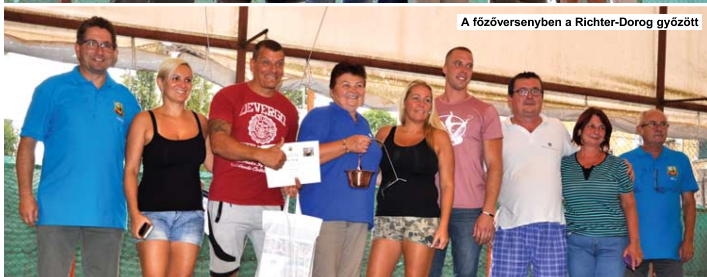
A főzőversenyben a Richter-Dorog győzött