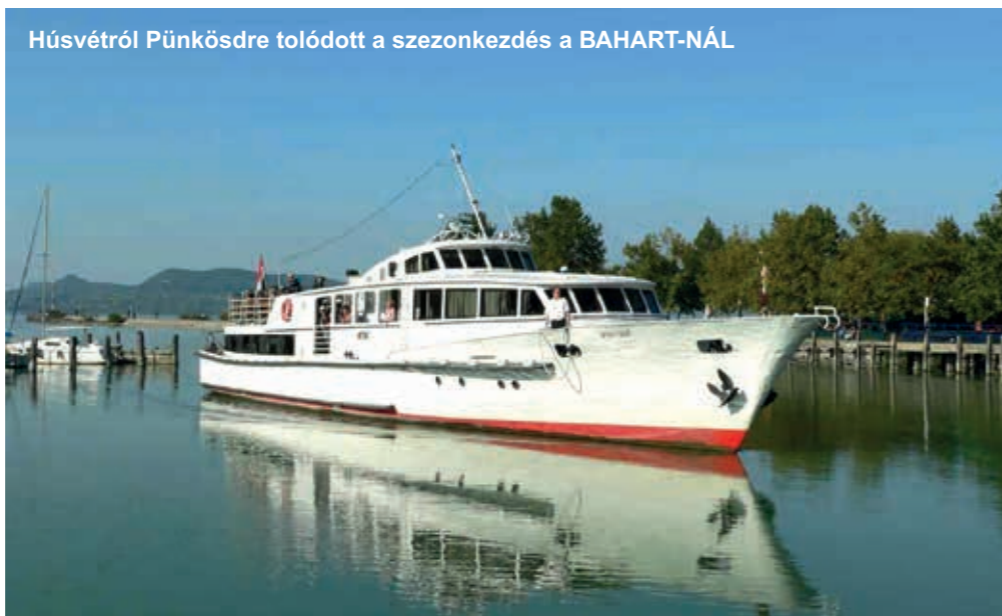
Húsvétről Pünkösdre tolódott a szezonkezdés a BAHART-NÁL

mivel nőtt. Májusban és júniusban és júliusban csökkent, és csökken a munkaidő 4 órára, a hiányzó 4 órára pedig megigényelték a támogatást, amit vissza is igazoltak. Ha megugrana a rendelésállomány, akkor könnyen át tudnak majd állni a rendes munkaidőre. Nem kellett senkit elküldeni se a Le Beliertől, se a MAL-tól. A bértámogatás miatt egyébként 4 hónapig nem is lehet elküldeni senkit a munkahelyéről. Az Alconics Székesfehérvárnál 1000-1200 ember keréktermékeket készít, például alufelniket nagy teherautókhöz. Az első körben a szellemi állományánál 10%-os alapbér-csökkentés történt, a fizikai állományánál nyolcóról hét órára csökkentették a munkaidőt. A Le Belier-nél és az Alconics-nál fizetett szabadságot vetettek ki a munkáltatókkal. Az ágazathoz tartozik a Hydro nevű norvég cég, ahol 350 ember dolgozik, december végéig állapítottak meg munkaidőkeretet, és most tárgyalnak arról, hogy ezt két évre növeljék. Ha belemennek, akkor ellentétlelésként az jöhet szóba, hogy ne bocsássanak el embereket.