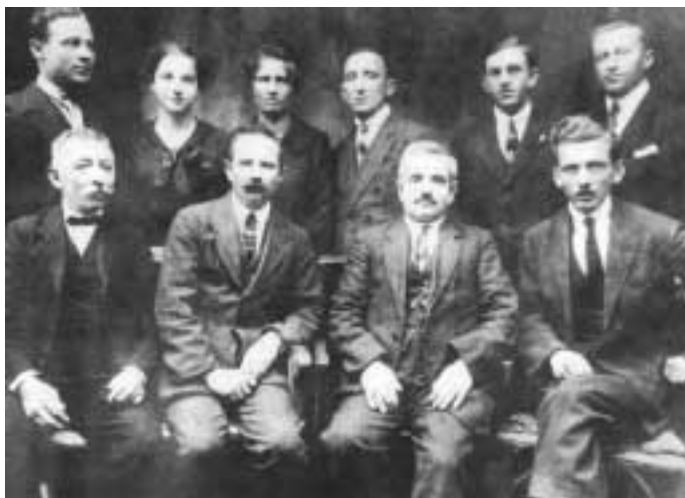
Szakszervezetünk vezetői a megalakulás utáni első években

vetítői és szervezői munka még inkább sürgette az önálló vegyészeti szervezkedést. A vasasok külön szakosztályaként a budapesti vegyészeti munkások sztrájkban győztek, és a gazdasági eredmények mellett azt is kiköthették: „a munkások szervezkedésük miatt, s bizalmi férfiai ezen megbízatásukból kifolyólag meg nem rendszabályozhatók”.