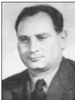
Darvas József országos titkár (1949-1950)